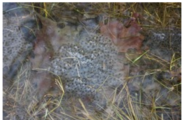
Ponte en amas de grenouille rousse