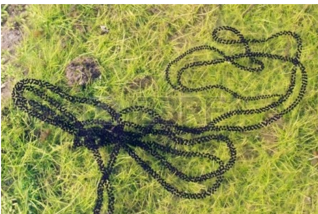
Ponte en chapelets de crapauds communs